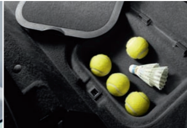
Deux coffres de rangement sous le plancher arrière