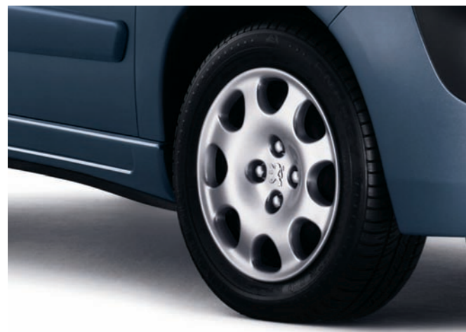
Enjoliveur Cuba 14"