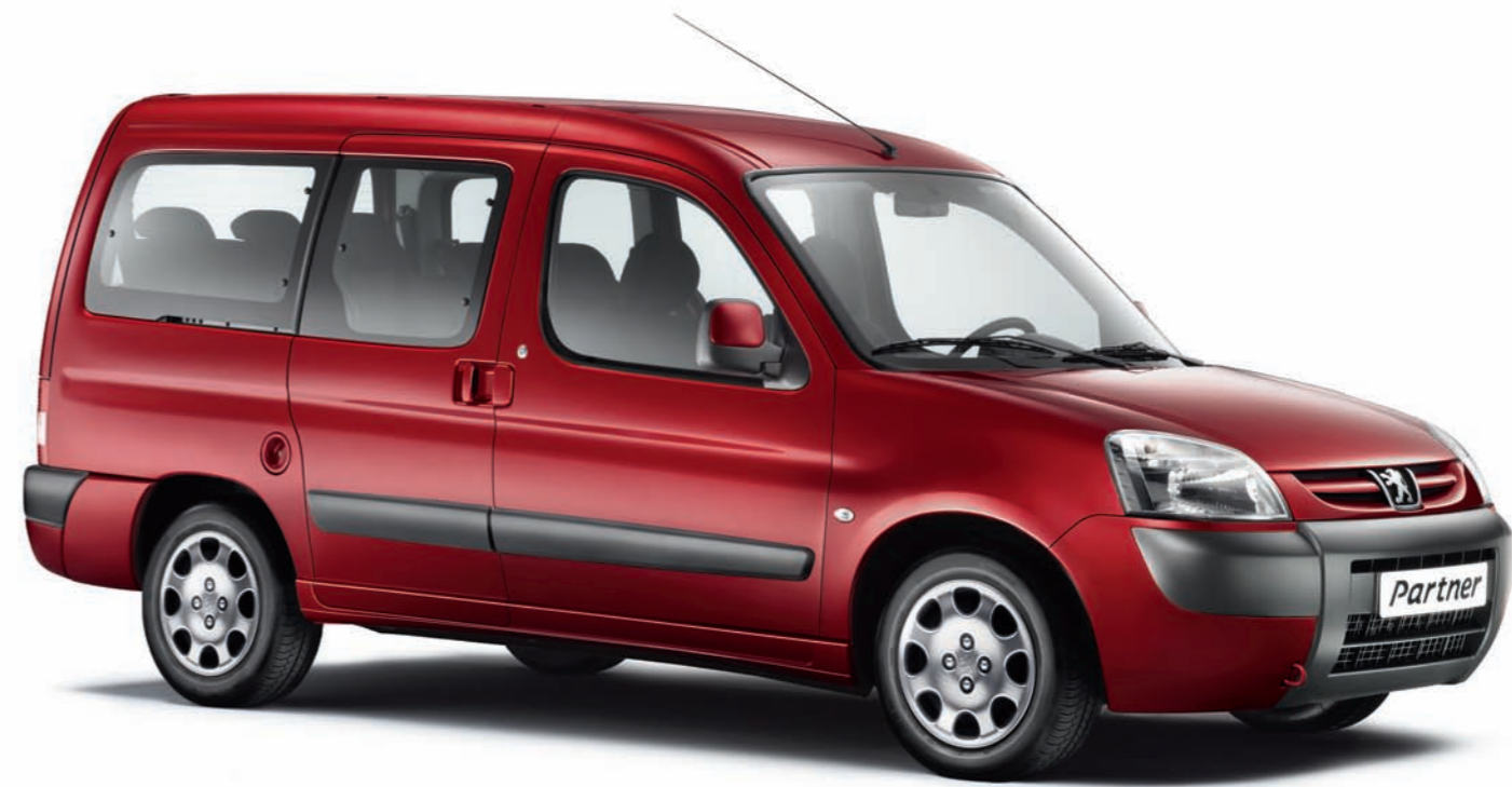
Partner Origin long avec Pack Look Présentation en Rouge Ardent