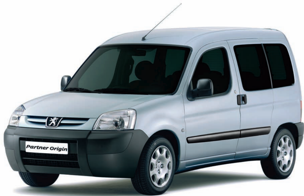
Partner Origin Court

Avec son aspect inspirant robustesse et dynamisme, Partner Origin signe son appartenance à l'univers des véhicules de loisirs. Ses projecteurs à glace lisse, son bouclier avant haut et imposant affirment son caractère baroudeur et unique. En version longue, Partner Origin peut accueillir 7 personnes à bord pour le plaisir de tous.