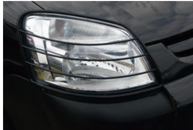
Avec le Pack Look VTC, les projecteurs sont équipés de grilles de protection.