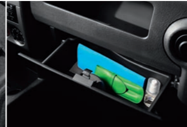
Boîte à gants avec volet

Avec ses deux larges portes latérales coulissantes (deuxième porte côté gauche en option), Partner Origin sait toujours réserver le meilleur accueil à ses passagers que ce soit en version courte ou en version longue.