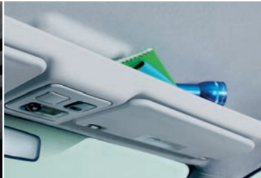
Capucine de rangement avec lecteur de cartes (option)